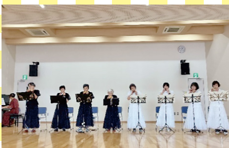
オカリナ星班・オカリナ宙班 (丸岡町)