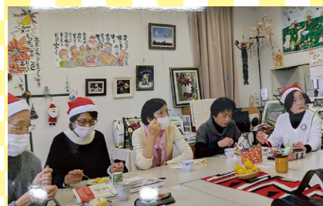
ハッピーサロン (丸岡町)