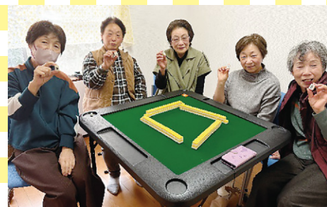
健康麻雀班 (福井市)