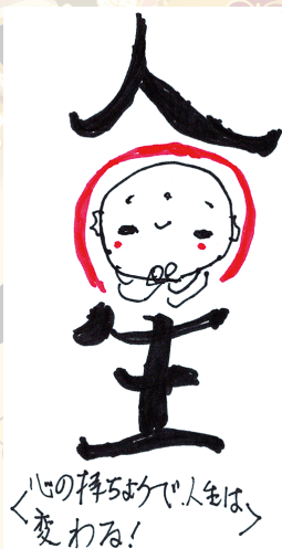
越前市 山本隆徳作