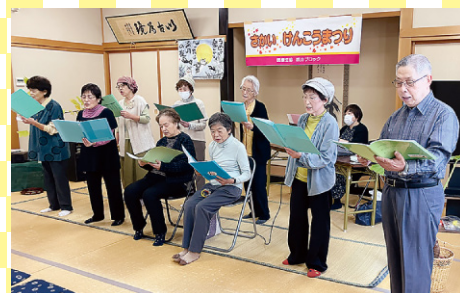
歌をたのしむ班 (丸岡町)