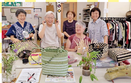
クラフトテープ班 (丸岡町)