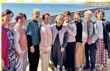
だんだん あみあみクラブ (福井市)