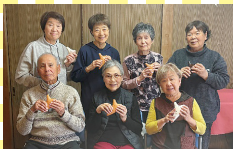
オカリナ班 (福井市)