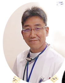
福井県医療生活協同組合

新年あけましておめでとうございます。組合員の皆さまには、旧年中も医療生協の活動に多大なるご支援・ご協力を賜り、心より御礼申し上げます。 昨年は、長引く物価高騰により、地域のくらしに大きな負担が生じました。特に、古古米という流行語も生まれた、いわゆる「令和米騒動」とも呼ばれた米の価格高騰や、一時的な供給不安は全国のお家庭に不安をもたらし、食と健康の結びつきを改めて考えさせられる出来事となりました。