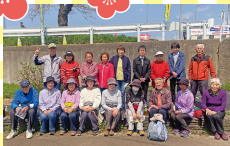
足羽 グラウンド・ゴルフ班 (福井市)