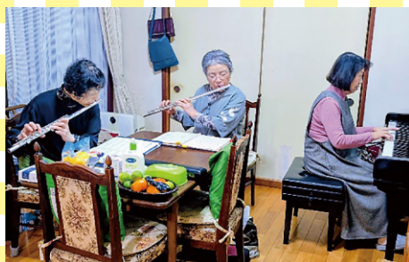
スマイル60班 (福井市)