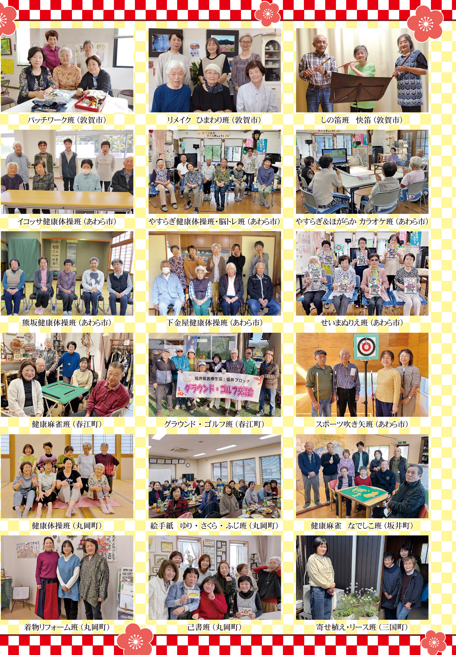
パッチワーク班 (敦賀市)