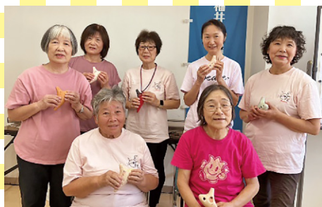
オカリナ班 (越前市)