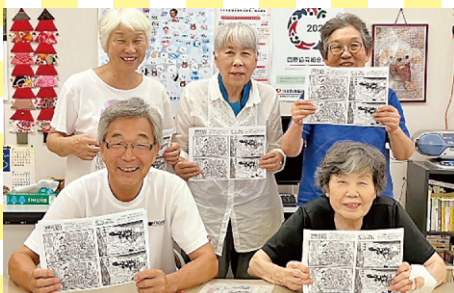
脳いきいき筋肉もりもり班 (敦賀市)