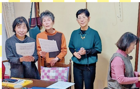
うたの会あじさい班 (福井市)