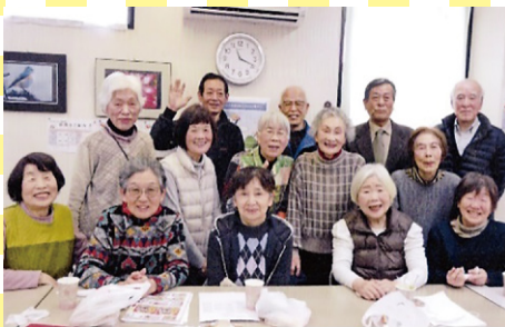
グラウンド・ゴルフ なごみ会 (敦賀市)