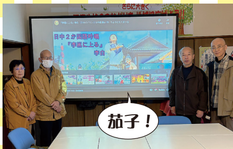
漢詩を歌って中国語班 (福井市)