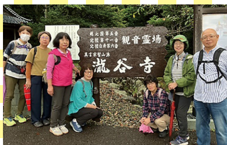
いち・に・散歩会 (越前市)