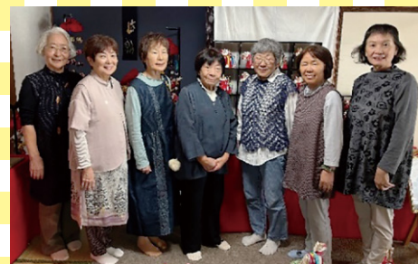
着物リメイク班 (福井市)