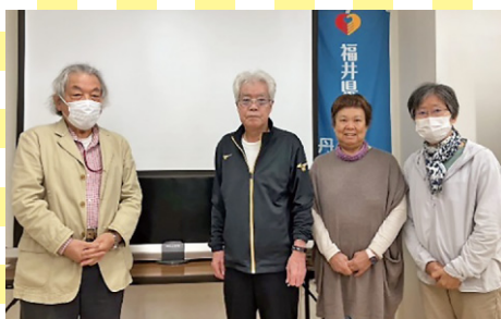
シアター会 (越前市)