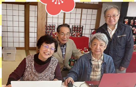
パソコン班会 (福井市)