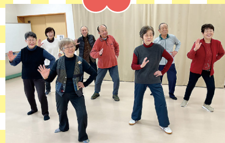
西藤 気功班 (福井市)