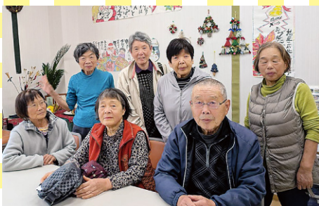
ハッピー農法班 (丸岡町)