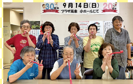
けんこうで長生き班 (敦賀市)