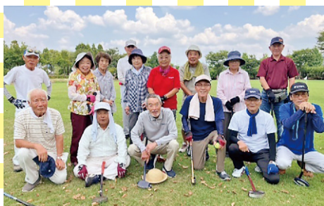
グラウンド・ゴルフ班 (越前市)