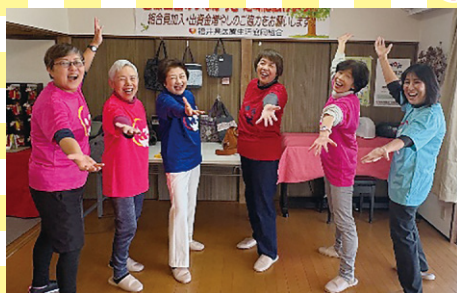
笑いヨガ「ワハハの輪」班 (福井市)