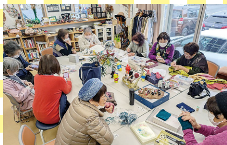
手作りちくちく班 (丸岡町)