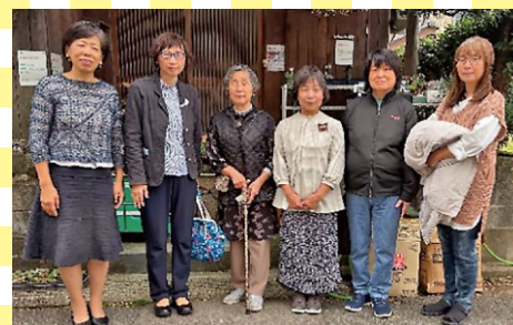
和田 あみもの班 (福井市)