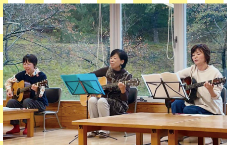
だんだんギターサークル (福井市)