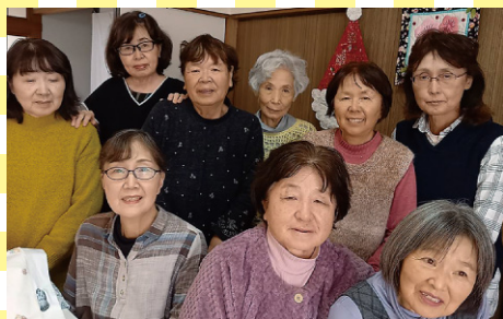
パッチワーク班 (福井市)