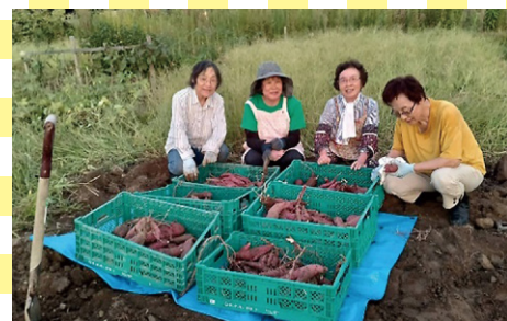
野菜づくりサークル (越前市)