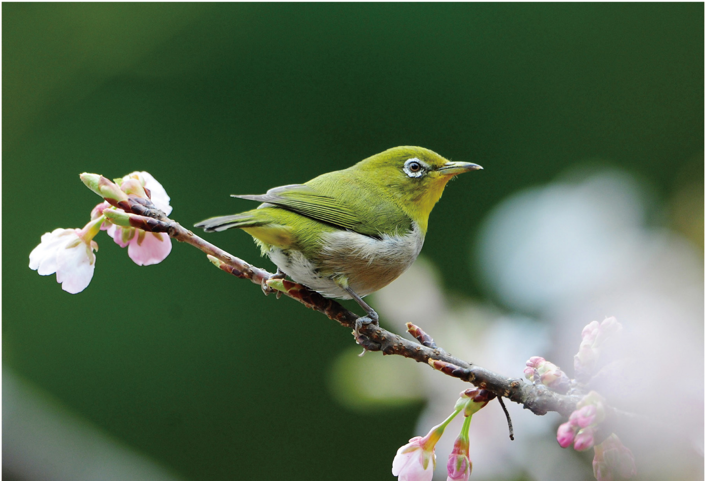
【撮影】Tさん (福井市) 桜とメジロ

2 月 度 組合員ふやし 28名 出資金ふやし 1,556千円 2024年2月29日現在 組合員 21,837名 出資金 570,110千円