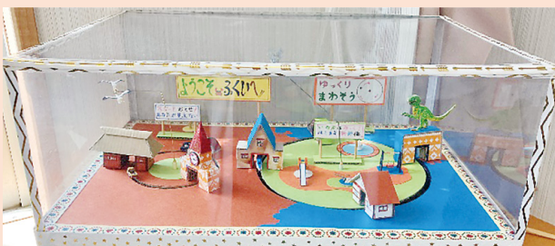
手回しからくり人形 (北陸新幹線に沸く町)