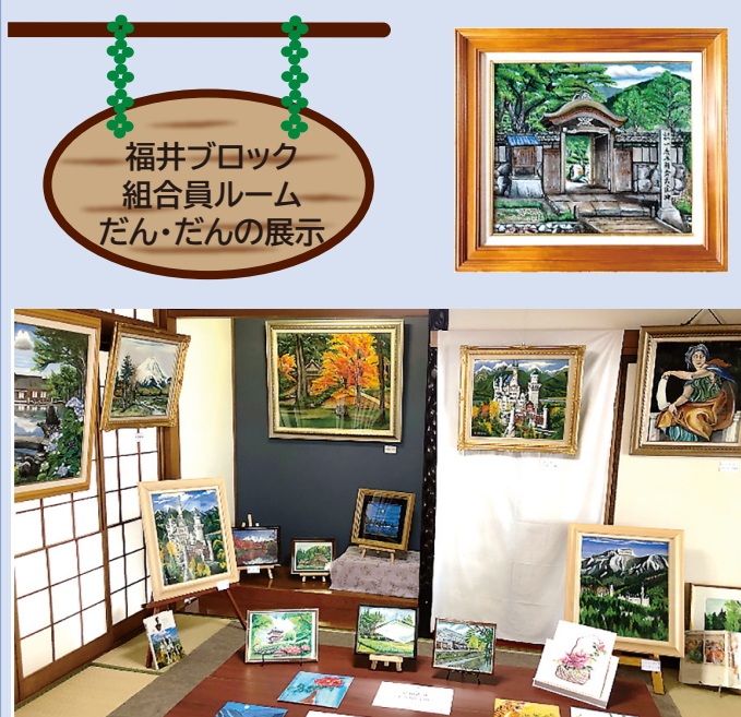
福井ブロック 組合員ルーム だん・だんの展示