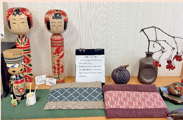
津軽のこぎん刺し こけしとともに