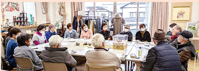
*ハッピーカフェ* 「男性よもやま話」開催！ 白川静氏との思い出も聞けました。