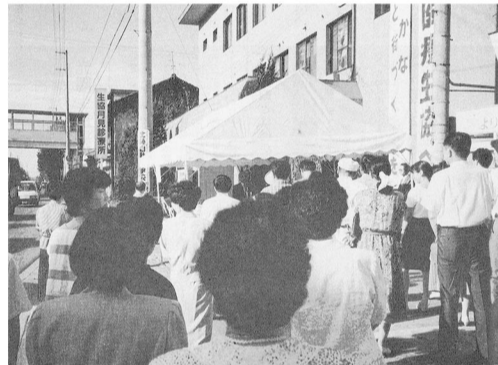
月見診療所開所式 1990年8月25日