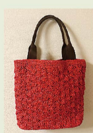
福井市・病院ブロック あみもの班&パッチワーク班作品