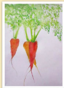
金津支部 水彩画班作品