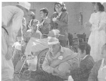
寝たきりでも頑張る運動会(1990年)

●「医師や医療スタッフだけでなく、一般の方々の医療に対する思いを聞くことはとても勉強になります。世の中を良くしていくための運動という視点を失わないよう、福井県全体の視野に立って、特に老人医療を中心に考えていきたいです。」 ●「医療の問題とともに、地域住民に支えられた組織づくりを重視していきたいと思えます。」 次号へつづく