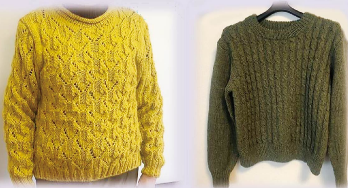
福井市・病院ブロック