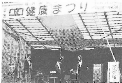
第1回健康まつり(1984年)

一九八八年に開かれた座談会を紹介いたします。当時医療生協を支えていた方々の熱意と行動が、現在の医療生協につながっていることが伝わってきます。