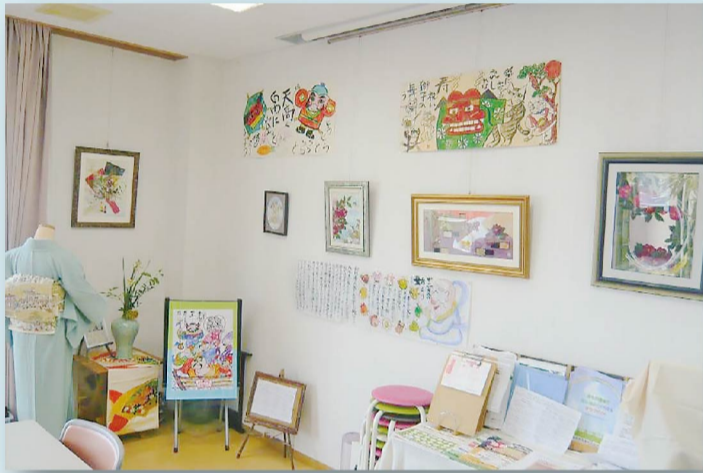
坂井ブロック 丸岡支部組合員ルーム・ハッピー展示風景