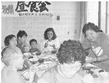
「減塩みそ」で試食会(1990年)

○「病院オープンから三年で五〇床のベッドを持つ病院になりましたが、今後どのような展望を持っていますか。」 ●「内科・小児科だけでなく、外科の入院・手術ができる病院にしていきたいし、看護婦さんを増員して、一人当たりの患者数を改善し、より大きな病院にしていきたいですね。」 ●「明里橋や水越橋が改修されたことは、病院にとって幸運でした。大きくしていくだけでなく、地域のみなさんから信頼される病院にしていかなければと思います。」 ●「診療所は医療の原点と言われています。医師にとって診療所を経験することはとても大事です。診療所を一つ、二つつくって、病院の職員が診療所を経験できる場が大事だと思います。」 ●「老人、子ども、障がい者に