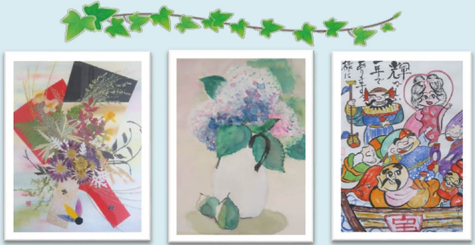
草花押し絵作品 水彩画班作品 絵手紙班作品